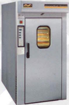
Rotor Slim Geschikt voor 60/40 platen