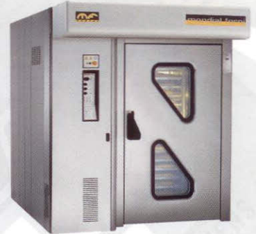
Rotor Wide Geschikt voor 80/100 platen