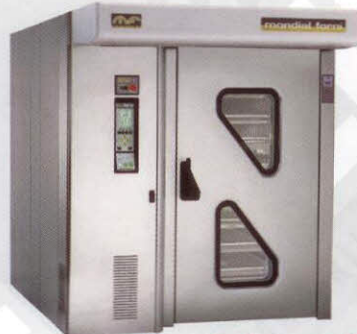
Turbomondial wagenoven zowel voor klein als grootbrood