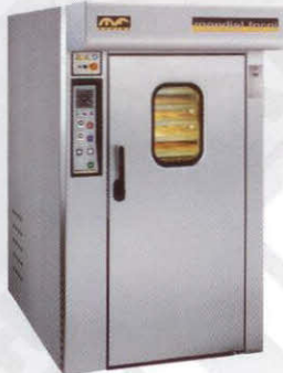
Rotor Basic Geschikt voor 60/80 platen