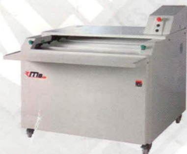
Rijskast MB voor o.a. stokbroden