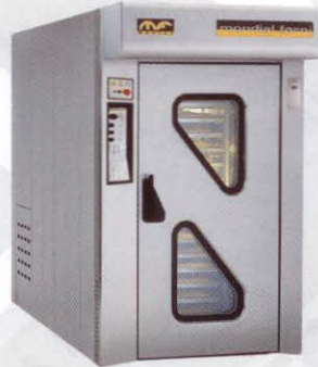
Rotor Plus Geschikt voor 60/80 (96 broden) en 70/100 (144 broden)